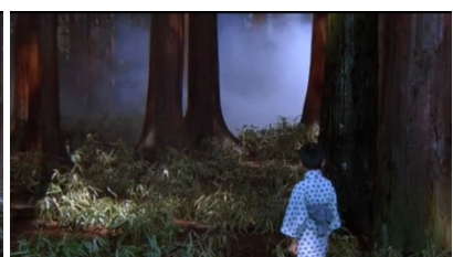
2 captures du film Sunshine through the rain ( Dreams ) réalisé par Akira Kurosawa en 1990, 119 min.