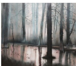
Magical forest, 95 x 110 cm, huile sur toile

1948 Drunken Angel, 98 min. 1954 Seven Samurai, 207 min. 1958 The Hidden Fortress, 139 min. 1963 High and Low, 125 min. 1975 Dersu Uzala, 141 min. 1990 Dreams, 119 min.