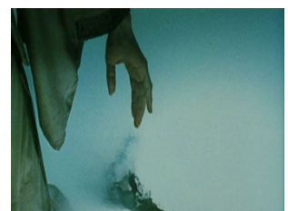
3 captures du film Mushishi réalisé par Katsuhiro Otomo en 2006, 131 min.