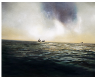
Valtari no 1, 40 x 50 cm Huile sur toile