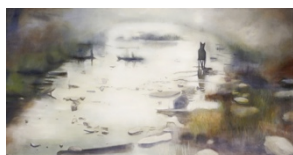
Stalker, 100 x 200 cm Huile sur toile

2 captures du film Stalker réalisé par Andreï Tarkovski en 1979, 163 min.